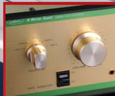
LEBEN Japanci ne prestaju da iznenađuju