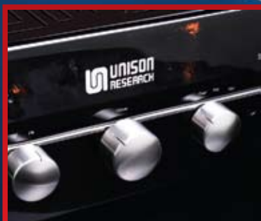
UNISON RESEARCH Zvuk sa italijanskim pedigreeom

MUSIC CD NOVOGODIŠNJI POKLON RBL REBEL STAR-SO